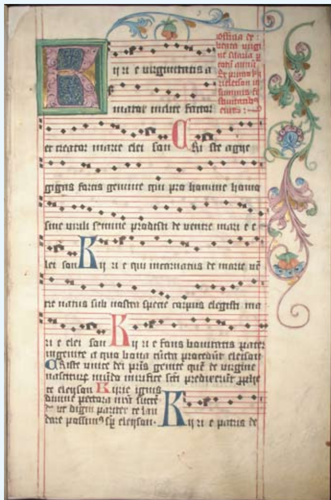
Jedna z kart rękopisu Graduat Officia de Beata Maria Virgine

(ciąg dalszy w następnym wydaniu Wiadomości Ratuszowych )