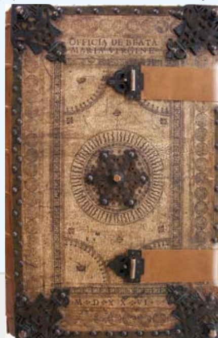
Graduat Officia de Beata Maria Virgine - oprawa